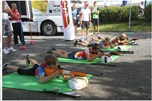
. . . bevor es zum Lasergewehrshiesen und mögliche Strafrunden ging.