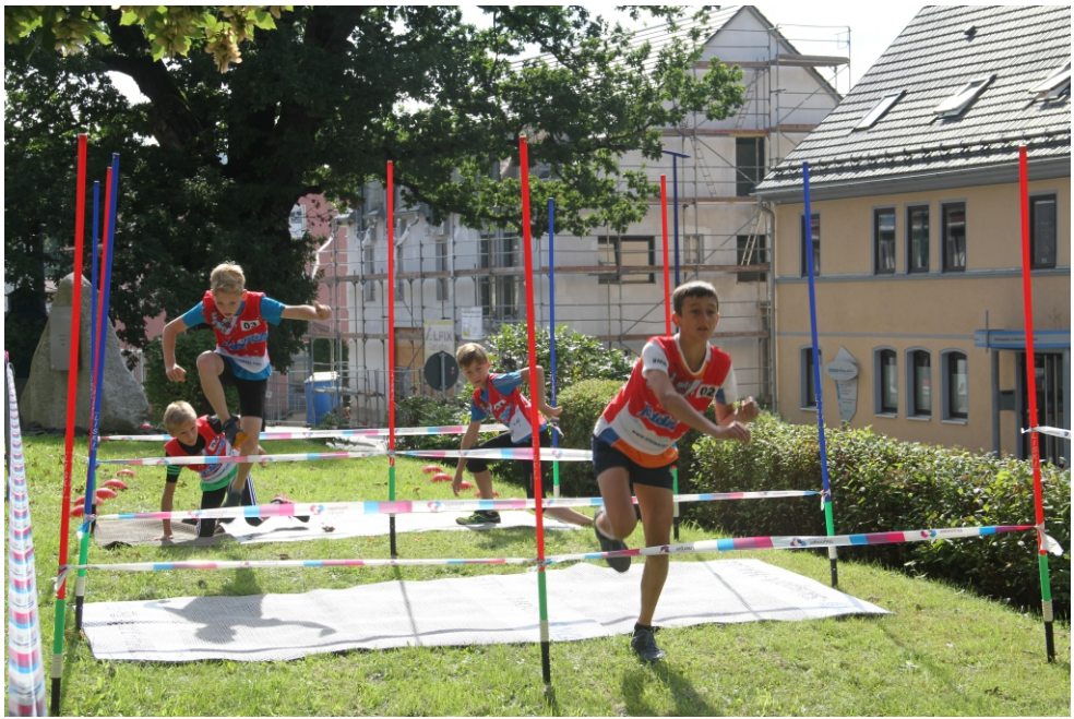
Der Hindernisparcour forderte Einsatz, Geschicklichkeit und Sprintqualitäten . . .