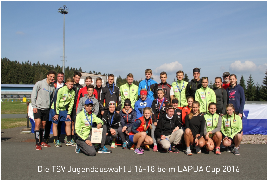
Die TSV Jugendauswahl J 16-18 beim LAPUA Cup 2016