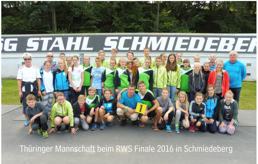
Thüringer Mannschaft beim RWS Finale 2016 in Schmiedeberg